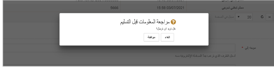
صورة 9 رسالة التأكيد

5. اختر الطرف المراد التعليق على أقواله من القائمة (موجه إلى) وفي حال وجود أكثر من طرف يمكنك اختيارهم وبعد ذلك أدخل الأقوال في المربع النصي (محتوى المحادثة الإلكترونية) ثم اضغط على تسليم فتظهر الرسالة التالية: